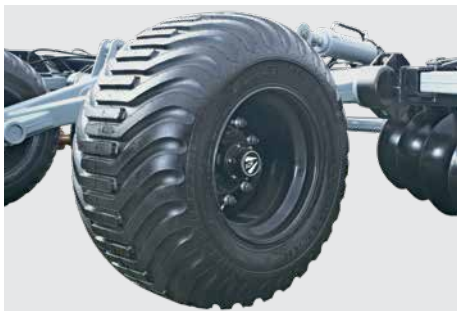
Pneus 600/50 22,5 TL.