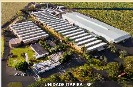
UNIDADE ITAPIRA - SP

Feno de qualidade, desde o corte até o enfardamento!