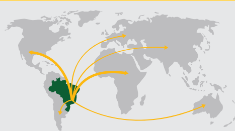
DO BRASIL PARA MAIS DE 50 PAÍSES