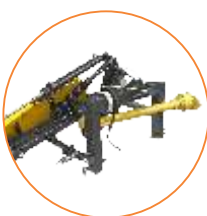
Acionamento por cardan c/ giro livre e transmissão por correias conjugadas