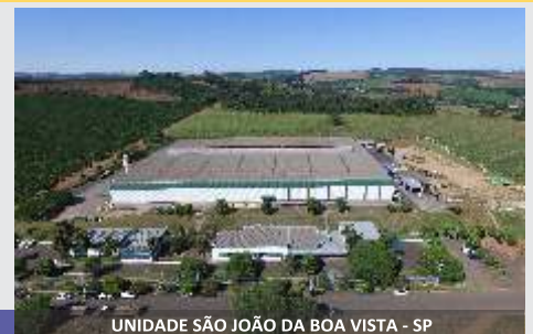
UNIDADE SÃO JOÃO DA BOA VISTA - SP

Linha de Fenação JF, a solução para o produtor!