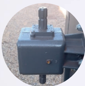
Caixa de transmissão direta com giro livre