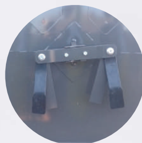
Conjunto de facas em aço reforçado