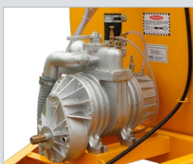
Bomba vácuo compressor 4 palhetas. Opcional: Bomba vácuo compressor 7 palhetas