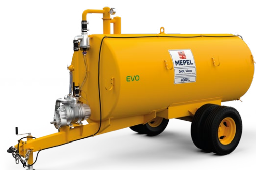
DAOL Vácuo Compressor 4000 1ERD aro 16"