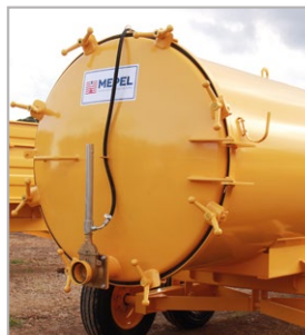
Tampa traseira de inspeção com abertura total