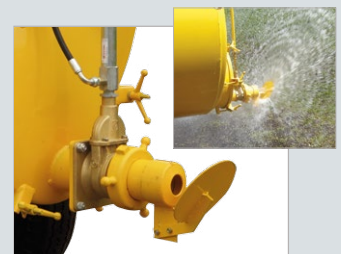
Bico leque aspersor: possibilita a distribuição do adubo orgânico numa faixa de até 15 m.