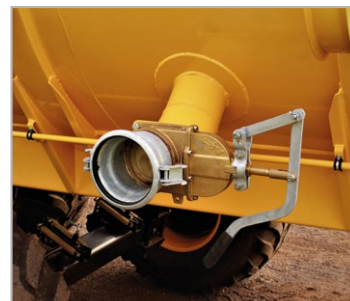
Registro de carga lateral