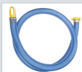
Mangueira de carga: para carga, descarga ou transferência de líquidos.