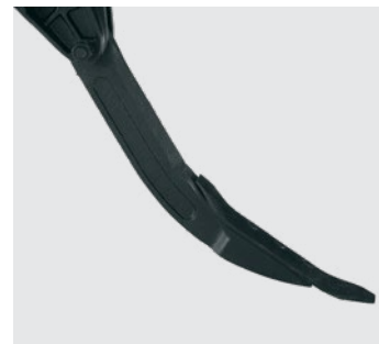
Bicos reversíveis das hastes. Reversible points. Puntas reversibles de los ejes.