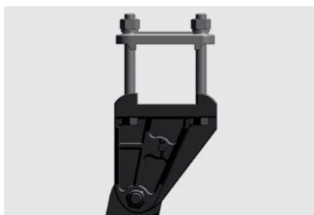
Haste subsoladora e dispositivo de segurança com fusível que se rompe ao receber grandes impactos. Tyne with safety device. Fleje subsoladora y dispositivo de seguridad con perno fusible que se rompe al recibir grandes impactos.