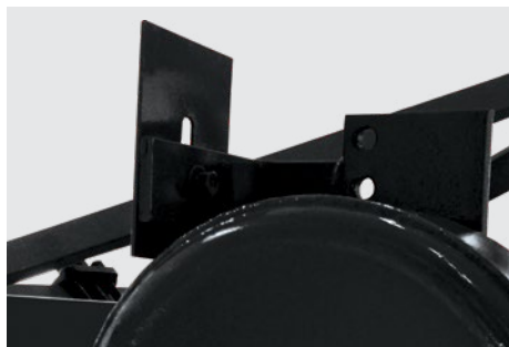
Limpador da roda de profundidade. Scraper for the depth control wheel. Limpiador de la rueda de profundidad.