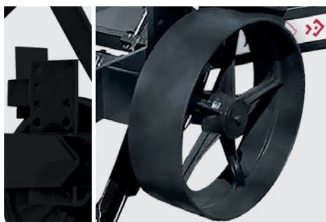
Roda para controle de profundidade com várias regulagens. Depth control wheel with many adjustments. Rueda para control de profundidad regulable.