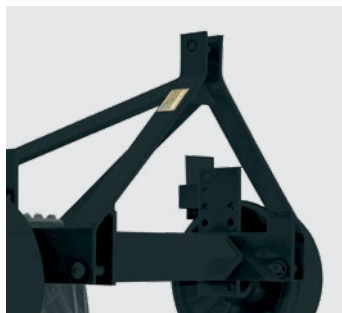
Cabeçalho de engate 3 pontos categoria II. Hitch: montend cat II. Enganche de 3 puntos categoria II.